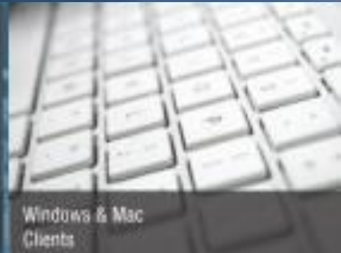
Windows & Mac Clients