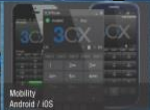
Mobility Android / iOS