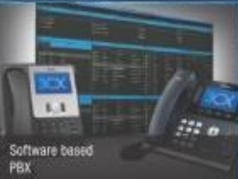
Software based PBX