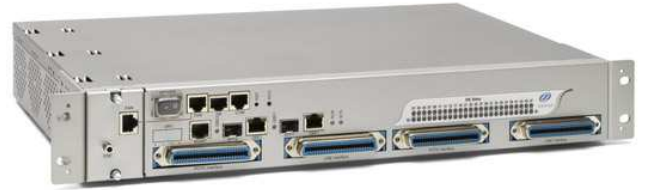
RP2-152 48ch ADSL2+ DSLAM

CLI/TELENT/WEB/SNMPによる多様なマネジメントインタフェースと、VLAN, QoS機能などの充実したネットワーク機能を搭載。小規模のキャリアサービスから、構内向けADSL接続まで幅広く利用できる