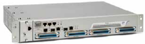
HP-152 48ch ADSL2+ DSLAM

CLI/TELENT/WEB/SNMPによる多様なマネジメントインタフェースと、VLAN, QoS機能などの充実したネットワーク機能を搭載。小規模のキャリアサービスから、構内向けADSL接続まで幅広く利用できる