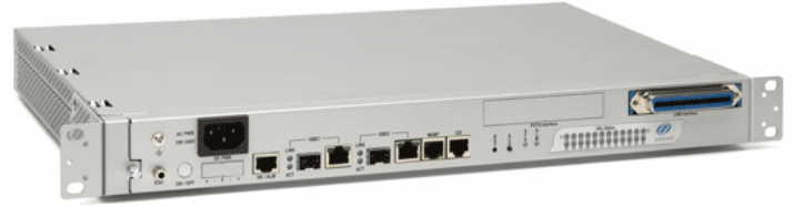
HP2-160 VDSL2 DSLAM

CLI/Telnetに加え、視覚的な操作が可能なWEBマネジメント機能やネットワーク機能(VLAN, QoS)など充実した機能と操作性を提供します。