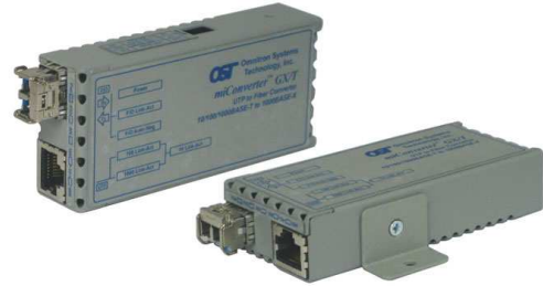
ウォールマウント

miConverter GXは、1000BASE-Tと1000BASE-Xを変換するスタンダードなメディアコンバータです。小型設計で設置場所を選ばず、デスクトップ上のPCやその他ネットワーク機器等の光ファイバ接続を容易にします。オプションのUSB電源アダプタケーブルを使用すれば、PCなどのUSBポートから電源を供給でき、デスクトップ上など他の場所・移動先でも手軽に光ファイバ接続を行うことができます。