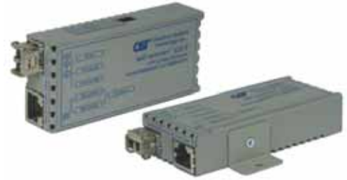
ウォールマウント

miConverter GXは、10/100/1000BASE-Tと1000BASE-Xを 変換するスタンダードなメディアコンバータです。 小型設計で設置場所を選ばず、デスクトップ上のPCやその 他ネットワーク機器等の光ファイバ接続を容易にします。オ プションのUSB電源アダプタケーブルを使用すれば、PCな どのUSBポートから電源を供給できるので、デスクトップ上で 余分な電源コンセントを必要とせず、また、ノートPCなどと共 に携帯して、他の場所・移動先でも手軽に光ファイバ接続を 行うことができます。 miConverter GX/Tでは、DIPスイッチによりリンクモードの 制御ができます。