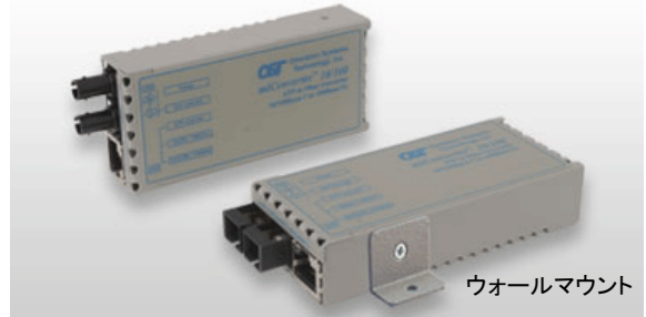
ウォールマウント

miConverter 10/100は、10/100BASE-Tと100BASE-FXを変換するスタンダードなメディアコンバータです。小型設計で設置場所を選ばず、デスクトップ上のPCやその他ネットワーク機器等の光ファイバ接続を容易にします。オプションのUSBパワーアダプタケーブルを使用すれば、PCなどのUSBポートから電源を供給できるので、デスクトップ上で余分な電源コンセントを必要とせず、また、ノートPCなどと共に携帯して、他の場所・移動先でも手軽に光ファイバ接続を行うことができます。